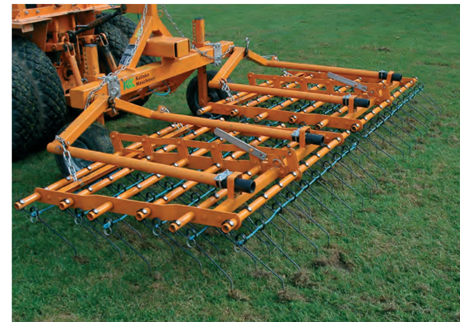
Entfilzen mit der Rasenhexe

Diese Pflegeanleitung können Sie kostenlos anfordern – Anruf genügt. Kontaktdaten finden Sie auf der Rückseite dieses Flyers. Gerne stehen wir Ihnen mit Rat und Tat zur Verfügung.