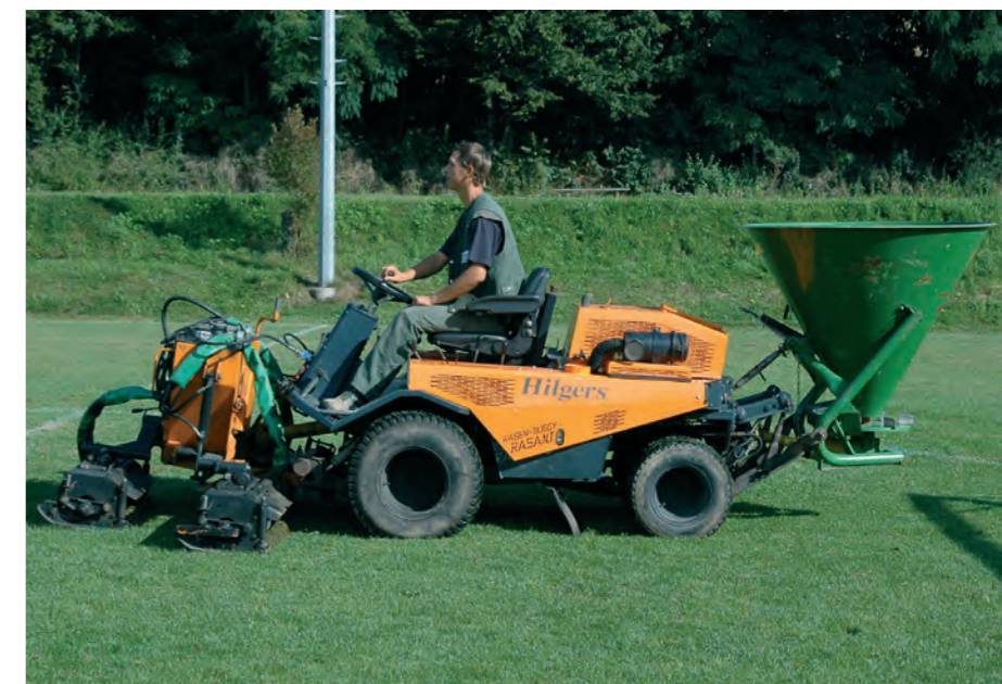
Fachmännische, systematische und regelmäßige Pflege