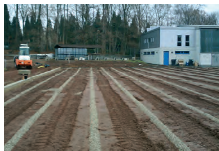
Verfüllung der Sickerschlitz