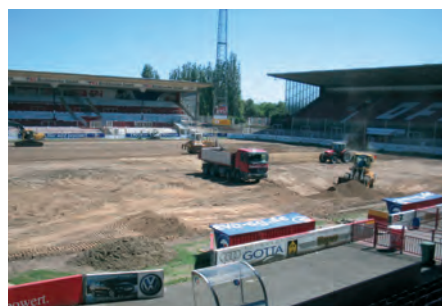
Für jede Arbeit die passende Maschine